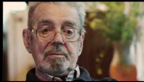
ALEXANDRE ALLILOUIEV Neveu de Staline