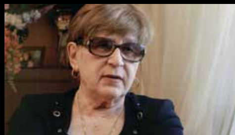
LUDMILA ALLILUEVA Femme du petit-fils de Staline